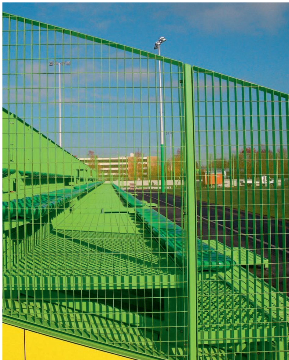
Die Einzäunung aus Gitterrosten dient als Absturzsicherung. La clôture en caillebotis sert de garde-corps.