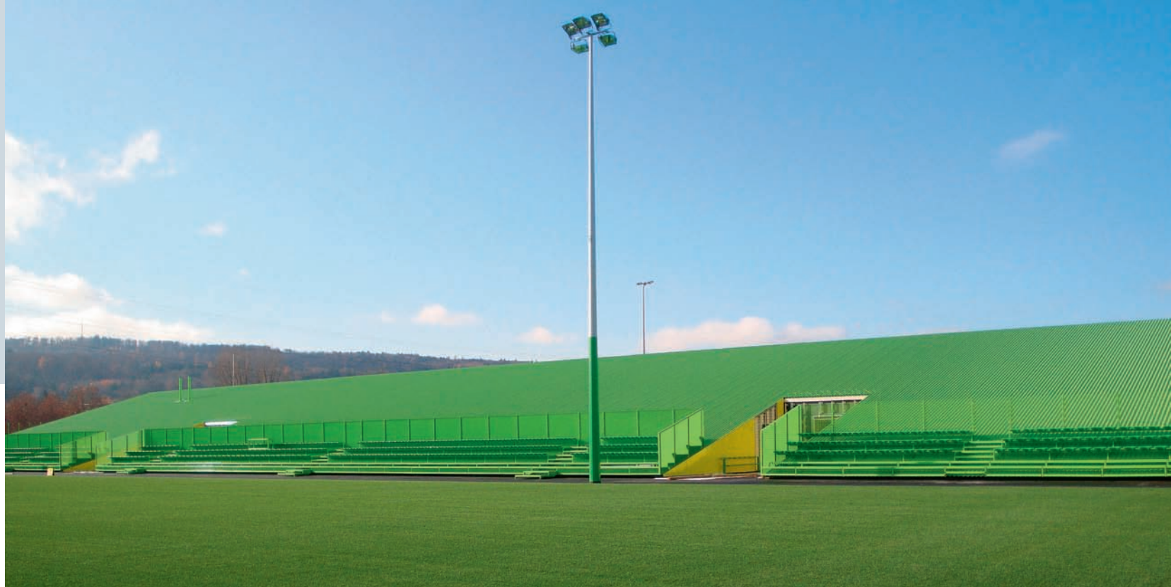
Ein unauffälliger Gebäudeteil – die Gitterrost-Tribüne.